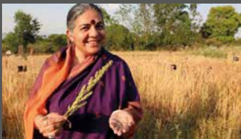
Vandana Shiva, Navdanya International

Die indische Wissenschaftlerin setzt sich seit über 30 Jahren für biologische Vielfalt ein. Sie kämpft für den Erhalt von Saatgut und für die Rechte von Kleinbauern und -bäuerinnen. Dafür erhielt sie 1993 den Alternativen Nobelpreis.