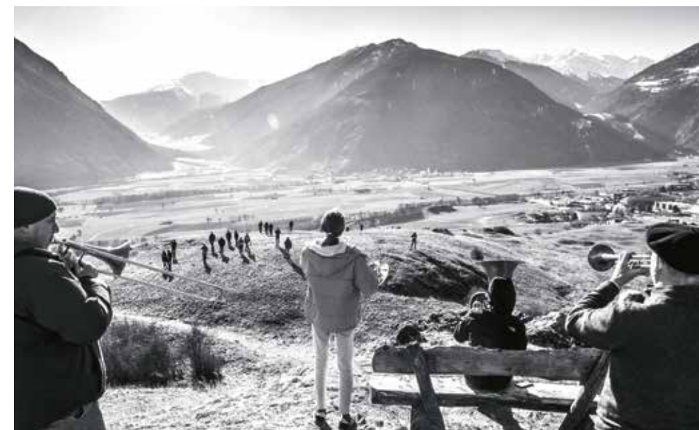
Natur, Kultur und Leben am „Tartscher Bichl“, Tartsch, Mals

vom 11. bis 14. April 2019 in Mals und Umgebung